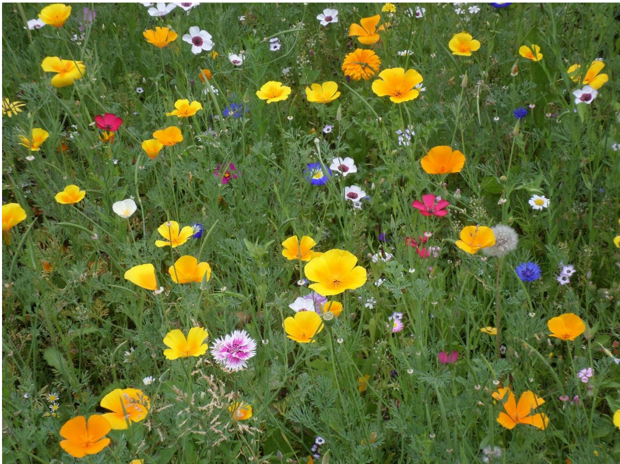
Blumenwiese auf unserem Außengelände